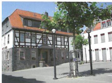
Neues Schloss Büdesheim